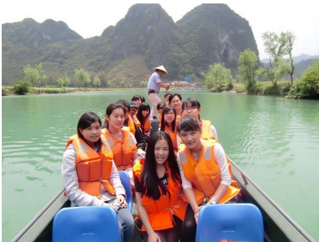
遊覽百鳥洞與香港文理同學和醫生合影