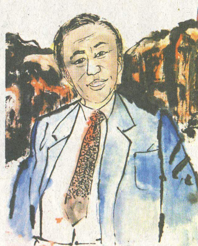
■溫千紅繪畫「光纖之父」高錕的水墨畫。