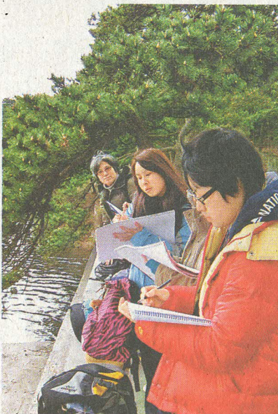
■參與「國民藝術教育計劃」的學生在井岡山寫生。